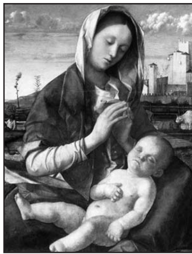
Il Bambino nudo di Betlemme, venuto per tutti i bambini e gli indifesi della Terra, nella beatitudine del grembo di Maria (Giovanni Bellini, Madonna del parto, part., Londra, National Gallery).

La gioia, invece, è altra cosa. Il filosofo Severino ha scritto: «Noi siamo la gioia». Ritengo che effettivamente questo sentimento sia squisitamente umano, proprio dell'uomo per la sua natura transitoria, per la sua durata limitata. È rara, ma capita la gioia. O capita con tanta più frequenza quanto più fine è la nostra sensibilità nel cogliere i momenti e gli aspetti della vita che ci donano gioia ed entusiasmi.