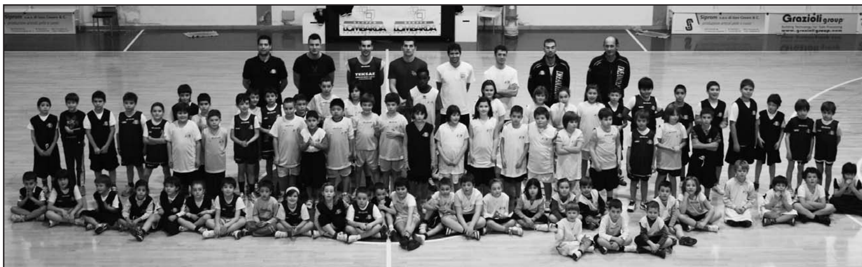
Alcuni dei ragazzi del Dream Team Montichiari.