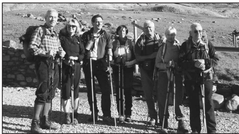
"Il contatto con la natura porta beneficio all'uomo".

Sullo stesso notiziario è riportata la notizia del convegno tenutosi, verso la fine dello scorso settembre a Borgosesia, dal titolo "Dalla scoperta del Monte Rosa alla montagnaterapia", con tematiche che hanno trattato il rapporto tra il contesto naturale e la dimensione dell'uomo, alle possibili declinazioni terapeutiche e riabilitative in ambito psichiatrico: esempio particolarmente riuscito il modello terapeutico-riabi-