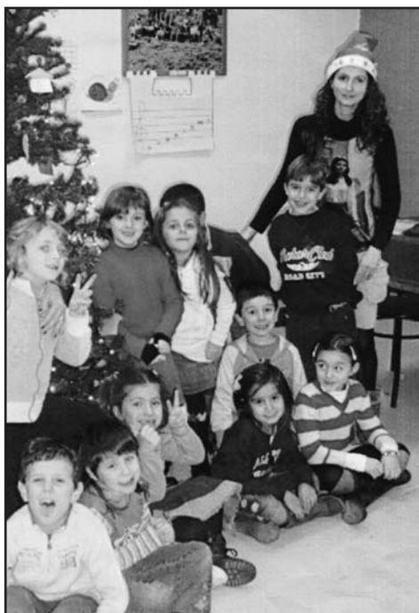
Gli allievi della scuola.

creare il ricambio generazionale, linfa vitale per un complesso bandistico sempre più all'altezza dei tempi.