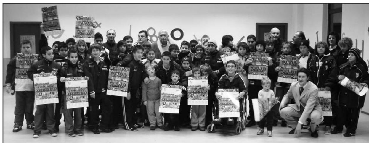
Foto ricordo della benefica iniziativa dell'Associazione UN SORRISO DI SPERANZA.

Da segnalare che la realizzazione ha permesso di instaurare un grande legame solidaristico tra i giovani giocatori dell'ACCADEMIA CALCIO verso i bimbi diversamente abili dell'ASSOCIAZIONE, sensibilità che ha soddisfatto dirigenti, consiglieri e genitori.